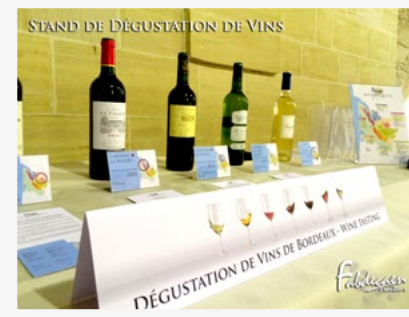
STAND DE DÉGUSTATION DE VINS