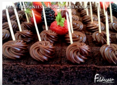
MINI-BROWNIES GANACHE CHOCOLAT