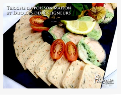
TERRINE DE POISSON MAISON ET DUO DES DEUX SEIGNEURS