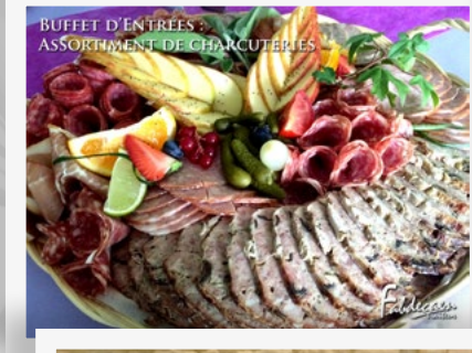
BUFFET D'ENTRÉES : ASSORTIMENT DE CHARCUTERIES