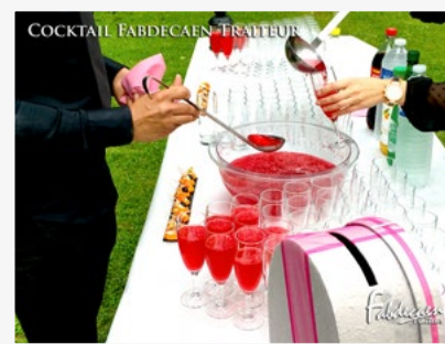
COCKTAIL FABRICECAEN TRAITEUR

Découvrez nos boissons-cocktail et forfaits. (Pages 9, 10 et 11 de notre carte)