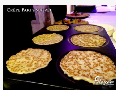
CRÊPE PARTY SUCRÉE