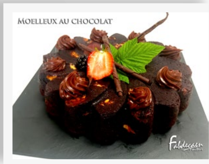
MOELLEUX AU CHOCOLAT