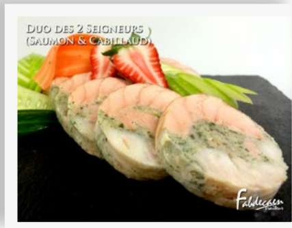
DUO DES 2 SEIGNEURS (SALMON & CABILLAUD)