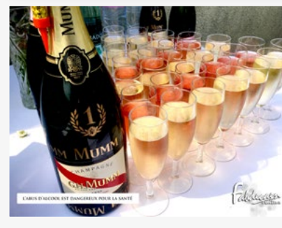
L'ABUS D'ALCOOL EST DANGEREUX POUR LA SANTÉ