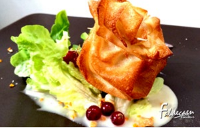
AUMÔNIÈRE DE FROMAGES NORMANDS TIÈDE