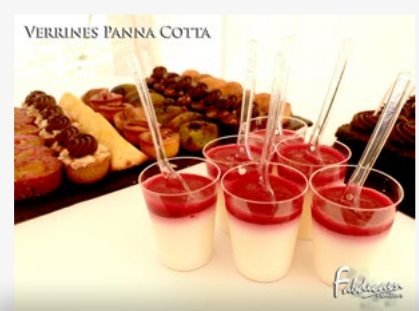
VERRINES PANNA COTTA