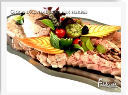
GIGOT D'AGNEAU ROTI AUX HERBES