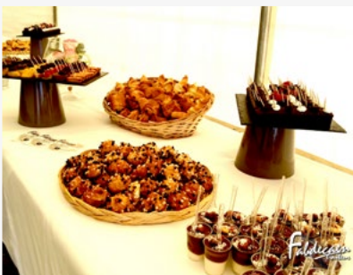
VIN D'HONNEUR - FLORE

Deux gammes de vins d'honneur s'offrent à vous. (Page 5 de notre carte)