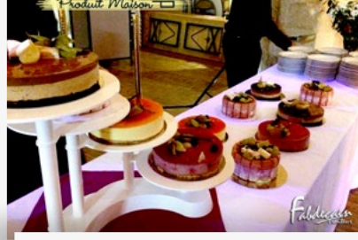
BUFFET DE DESSERTS