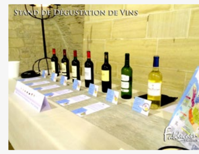
STAND DE DÉGUSTATION DE VINS