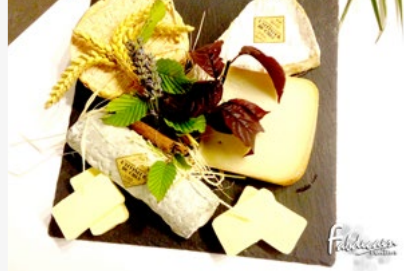
FROMAGES AFFINÉS AOP ET AU LAIT CRU