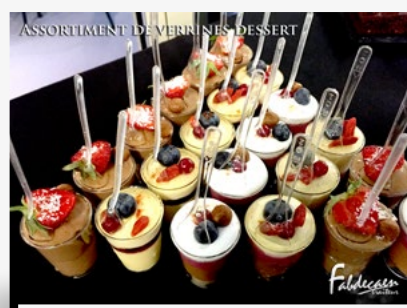
ASSORTIMENT DE VERRINES DESSERT