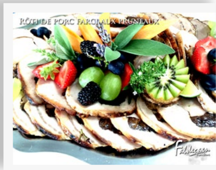
PÂTÉ DE PORC FARCI AUX PRUNEAUX