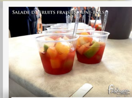
SALADE DE FRUITS FRAIS EN MINI-BOLS