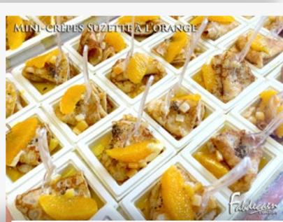
MINI-CRÊPES SUZETTE À L'ORANGE