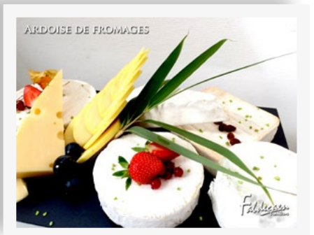
ARDOISE DE FROMAGES