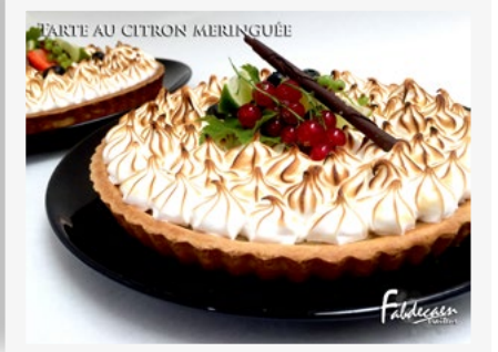
TARTE AU CITRON MERINGUÉE