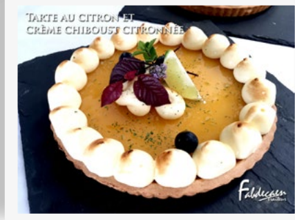
TARTE AU CITRON ET CRÈME CHIBOUST CITRONNÉE