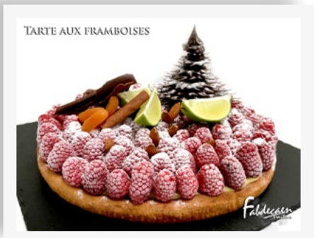
TARTE AUX FRAMBOISES