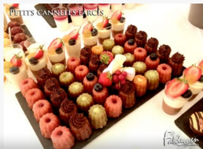
PETITS CANNELÉS FARCIS

Qui a dit qu'un cocktail n'a pas besoin de douceurs... Près de 20 pièces sucrées et 3 ateliers d'animations s'offrent à vous pour le plaisir des petits et des grands.