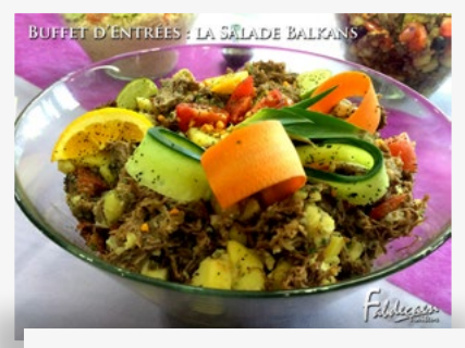
BUFFET D'ENTRÉES : LA SALADE BALKANS